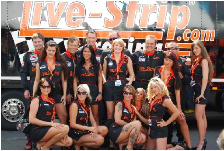
LiveStrip.com Racing Team mit den hübschen PR Girls am Nürburgrin